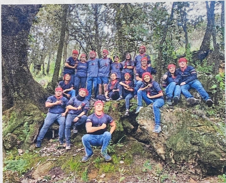
Los ejercicios físicos son llevados a bosques, donde los atletas aprenden montañismo, alpinismo y senderismo

Los ejercicios físicos son llevados a bosques, donde los atletas aprenden montañis-